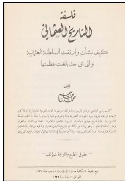
Gambar 1: Halaman muka hadapan karya Falsafah al-Tarikh al-'Uthmani cetakan Maktabah Shadir di Beirut pada tahun 1925.